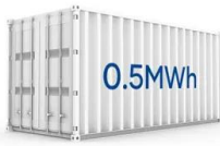
Standard 20ft containers