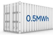
Standard 20ft containers

und Biogas. KACO new energy lieferte vier blueplanet gridsave 92.0 TL3-S als wichtige Schlüsselkomponenten für das Projekt.